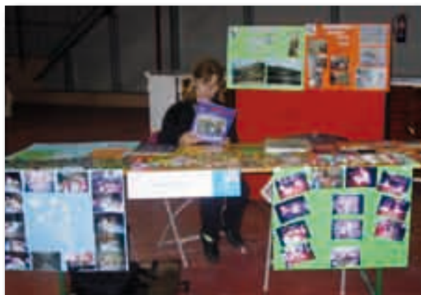
Mesa exposición y mercadillo en la Esfera (Alcobendas)

El 26 de abril se celebró la IV Feria de las Asociaciones de Alcobendas. Una vez más, la Fundación estuvo presente y recibió la visita del Alcalde D. Ignacio García de Vinuesa.