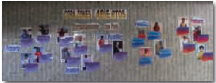
Montaje fotográfico a la entrada del pabellón.