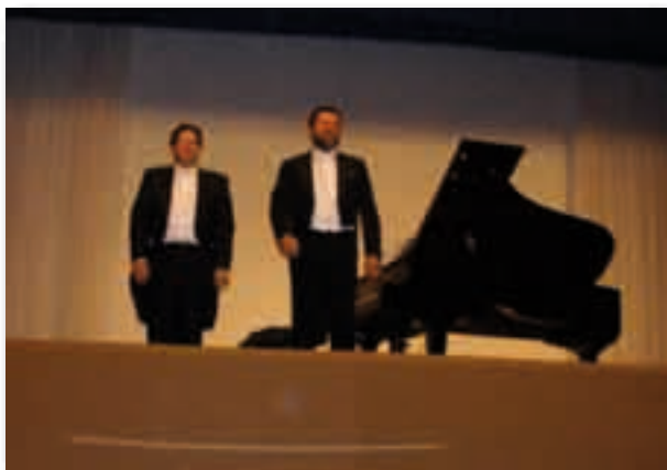
Los pianistas al finalizar el concierto

La comunidad Educativa Irlandesas de Bami, la Federación Católica de Padres de Alumnos de Sevilla con la colaboración de la Junta de Andalucía e Inmobiliaria del Sur han organizado un “Concierto Solidario” piano a cuatro manos el 14 de mayo en el Salón de Actos del Colegio de Bami, a beneficio de la Fundación Mary Ward.