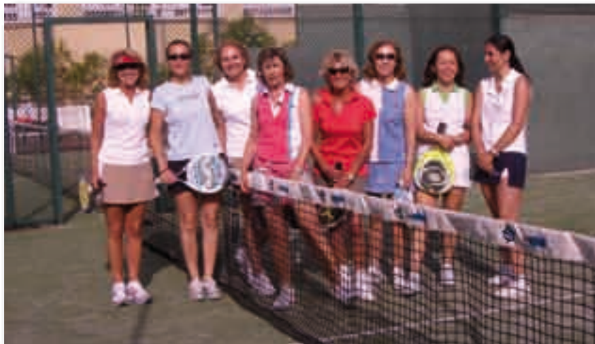
Participantes en el torneo