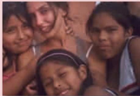
Macarena en Lampa