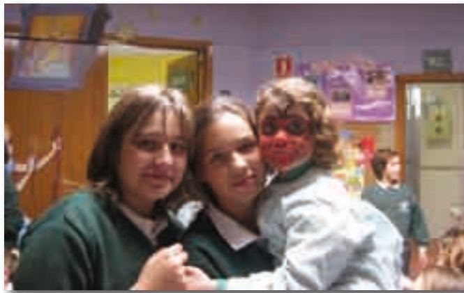
Taller de pintura en El soto

El día de los Sports también montamos un puesto con artículos variados en el que colaboraron varias madres del colegio.