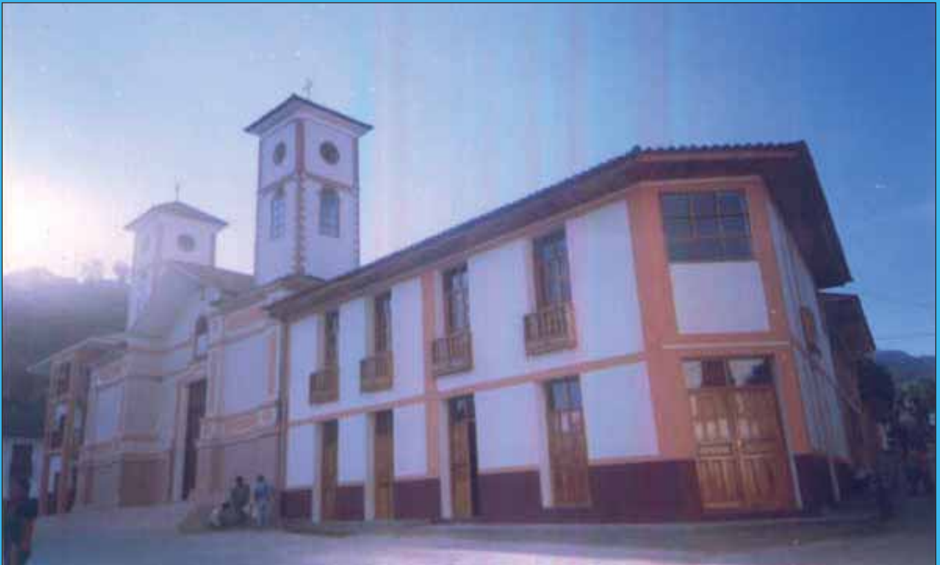
Edificio de nueva construcción en Lamud

O s ofrecemos detalladamente algunas de las iniciativas que la Fundación Mary Ward España ha puesto en marcha en Perú a lo largo del pasado año –2004–. Iniciamos un nuevo año lleno de ilusiones, compromisos y buenos propósitos con la satisfacción de haber concluido el pasado con más de 126.000€ destinados íntegramente a los distintos proyectos emprendidos por nuestra Fundación en Perú.