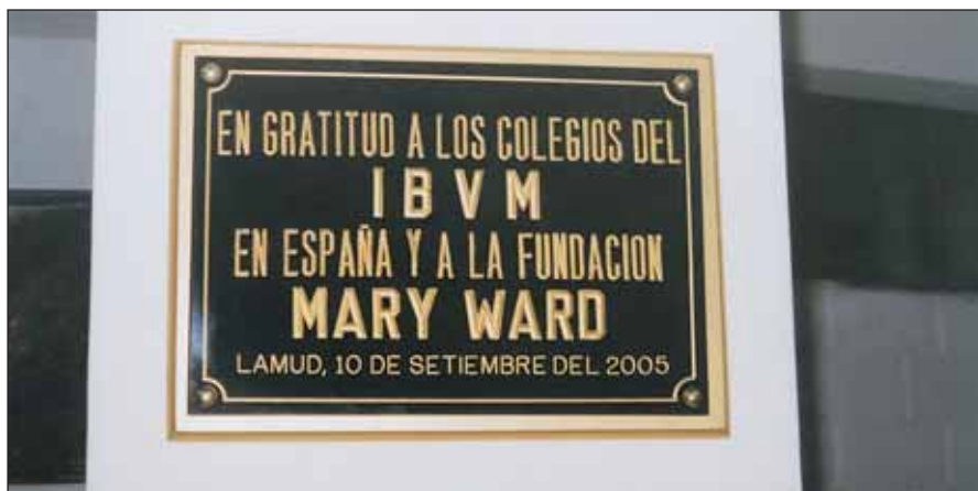
Placa conmemorativa en el Centro de Formación de Lamud

Cuando empezamos en la Fundación queríamos construir un modesto edificio pero el proyecto ha ido creciendo tanto, y son tantas las peticiones, que nunca creo que terminaremos de abarcar todo lo que